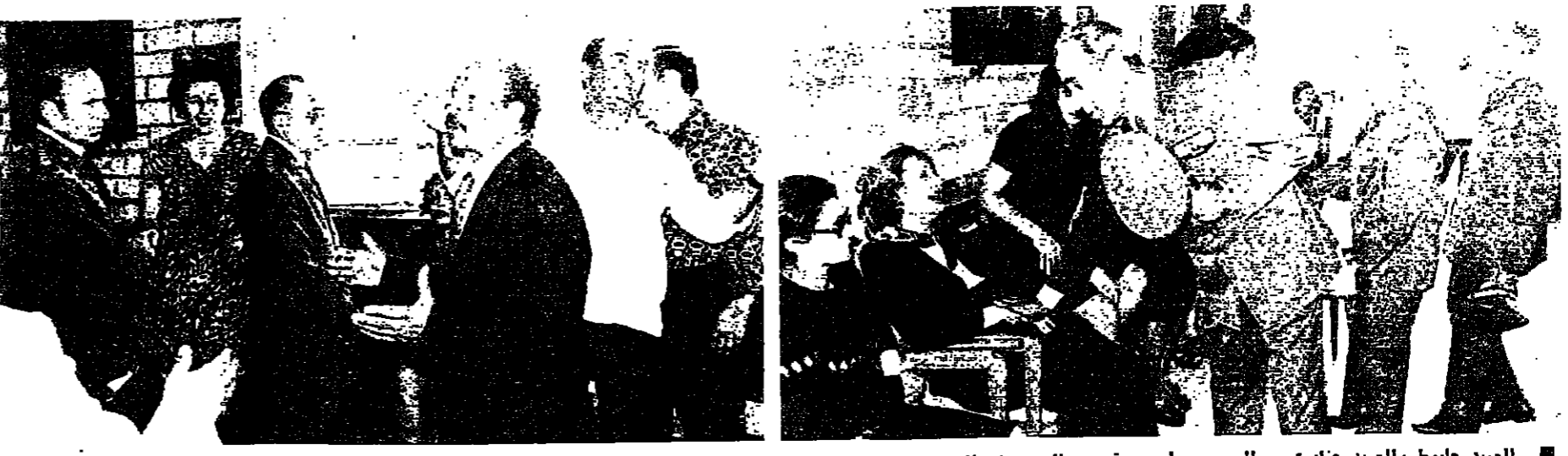
العميد جليوط والعميد جنادري والعميد راسي يقدمون التمازي لوالد الشهيد حروفش وعائلته يمشيولون التمازي